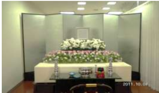
上記お見積りに使用している祭壇いる祭壇