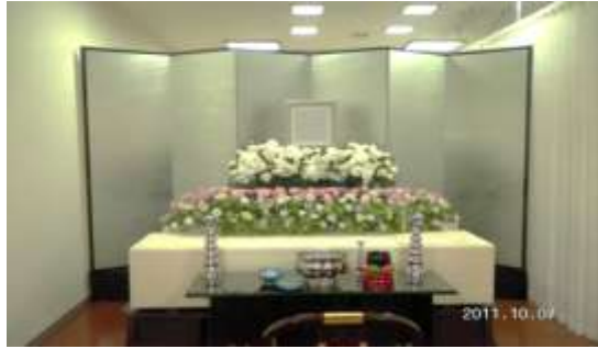
上記お見積りに使用している祭壇いる祭壇