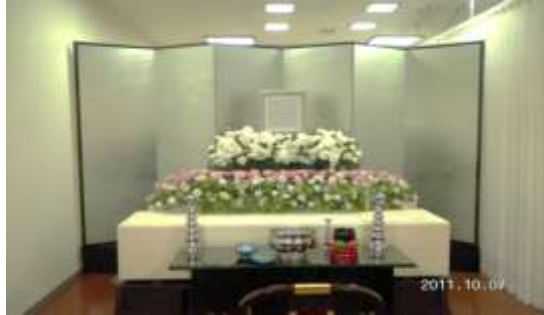
上記お見積りに使用している祭壇いる祭壇