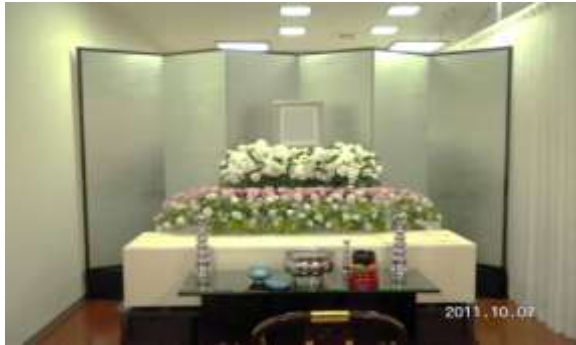
上記お見積りに使用している祭壇いる祭壇