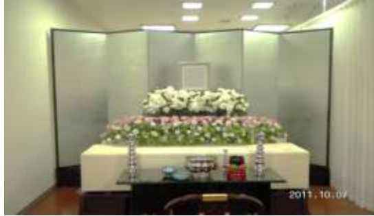
上記お見積りに使用している祭壇いる祭壇