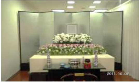
上記お見積りに使用している祭壇いる祭壇