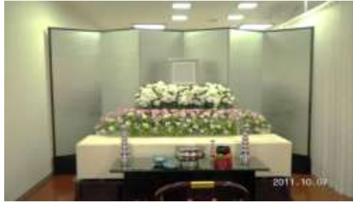
上記お見積りに使用している祭壇いる祭壇