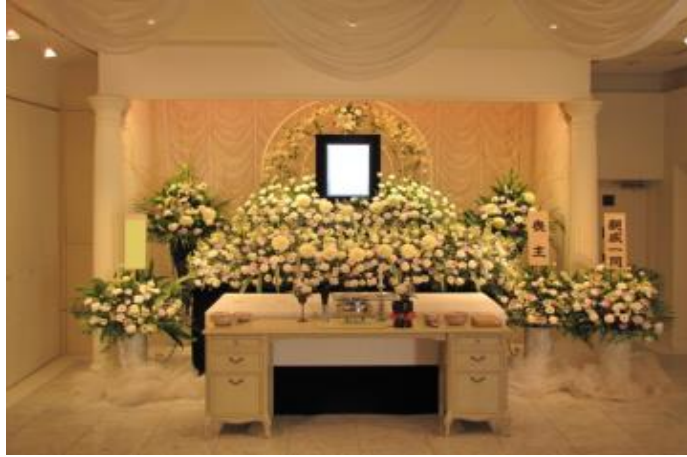
両サイドの生花は含まれません この他にも生花祭壇はございます

お見積りに使用している生花祭壇 150,000円(税別) ■祭壇の形はこの他にもございます