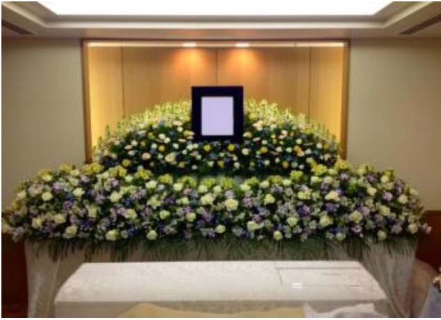
両サイドの生花は含まれません

お見積りに使用している生花祭壇 250,000円(税別) ■祭壇の形はこの他にもございます