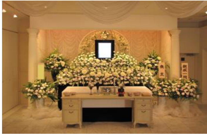
両サイドの生花は含まれません この他にも祭壇がございます

お見積りに使用している生花祭壇 150,000円(税別) ■祭壇の形はこの他にもございます